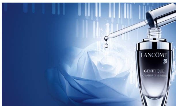
Figura 1. Publicidad de crema cosmética con referentes científicos para ser analizada mediante el test CRITIC. ¿Cuál es la afirmación? ¿Qué interés tiene su autor? ¿Ofrece datos? ¿Puede comprobarse? ¿Concuerda con lo que sabemos del ADN?

Las actividades de trabajo de esta instancia suelen promover en los alumnos un rol. En el ámbito científico la Ciencia Ciudadana propone que los ciudadanos participen en investigaciones de centros de investigación, generalmente recogiendo datos, participando en la